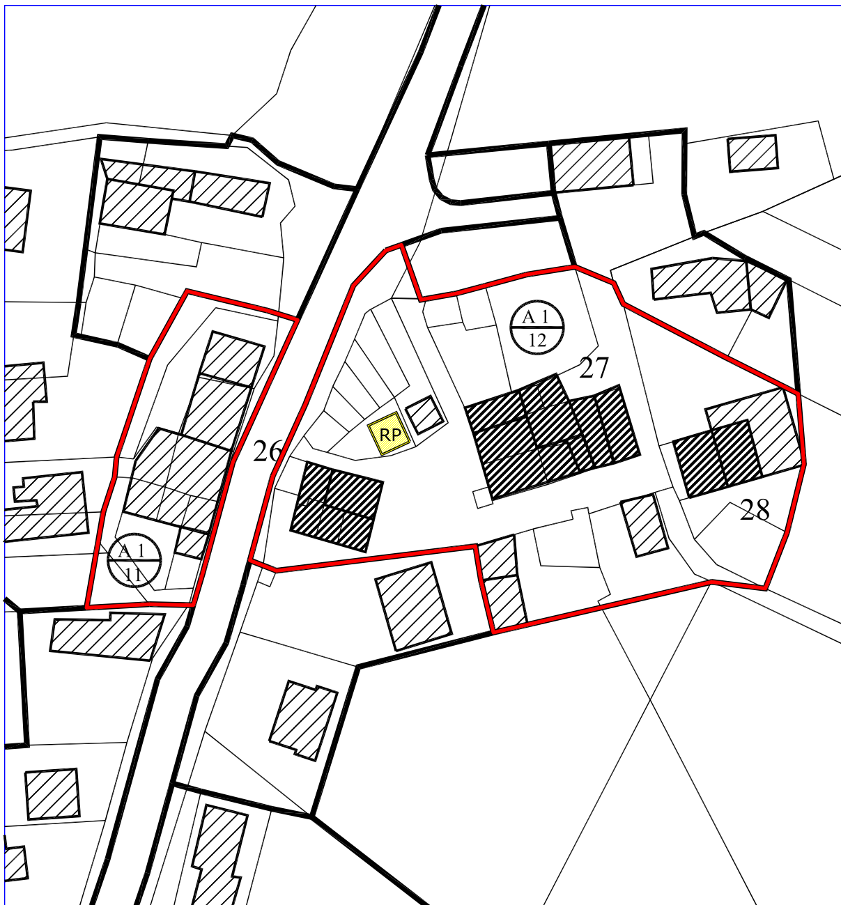
c) scheda di progetto - ingrandimento scala 1:1000

Indicazione "ambito massimo edificabile" ed edifici soggetti a ristrutturazione edilizia parziale "RP"