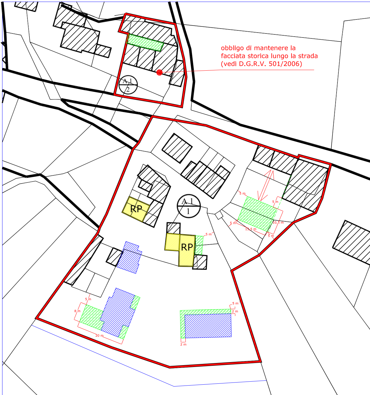
c) scheda di progetto - ingrandimento scala 1:1000

Indicazione "ambito massimo edificabile" ed edifici soggetti a ristrutturazione edilizia parziale "RP"